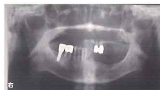
図 3-2-21 初診時のパノラマX線写真。欠損部顎堤も傾斜している