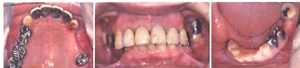
図 3-3-14 初診時口腔内所見。過蓋咬合で、咬合支持は前歯部と「Z」, 「7」のみである。「3」, 「4」は舌側に傾斜している。「4」にはメタルコーピングが装着されている

○患者: 60歳,女性 ○主訴: 上顎前歯部の動揺による咀嚼困難 ○残存歯: \frac{7654321123}{432112345} \frac{7}{47}