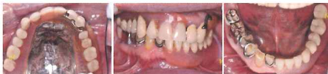
図 3-2-19 義歯装着時。人工歯には間歯が使用されている。「5」はチッピング、「1」には人工歯脱離の修理が確認できる