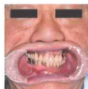
図 3-2-20 顔面正中に対して、咬合平面は傾斜している