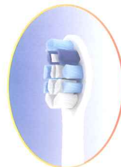
ガムヘルスブラシ

ハンドル1本、プロリザルツ ガムヘルスブラシ スタンダード1本、 充電器1台、取扱説明書(保証書含)