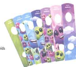
フロントパネルシール

アプリの詳細は、 ソニックケアキッズ WEBサイトへ http://www.philips.co.jp/c-m-pe/sonicarekids