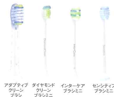
アダプティブ クリーン ブラシ ダイヤモンド クリーン ブラシミニ インターケア ブラシミニ センシティブ ブラシミニ

フレックスケアプラチナプロフェッショナル ハンドル 1本、ダイヤモンドクリーンブラシ ミニ 1本、インターケアブラシ ミニ1本、センシティブブラシ ミニ1本、アダプティブクリーンブラ シ1本、充電器1台、取扱説明書(保証書含)