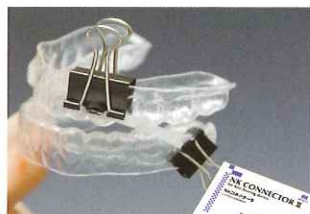
NKコネクターIIで上下顎装置の固着