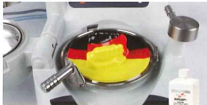
バイオプラスト用分離剤を模型に塗布しバイオプラストを1次プレス