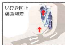
いびき防止装置装着 気道を確認し、いびきを防止