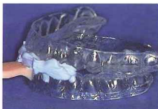
下顎前方位の設定