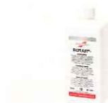
石膏分離材 バイオプラスト用分離剤 500mL 4,700円 新206360125 IB636125