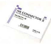
いびき防止用コネクター NK コネクターII 12,800円 新206360401 IB636401