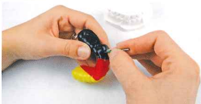
空気穴を明け、1次プレスした上にバイオプラストの2次プレス