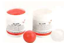
ブロックアウト用シリコン シルキッド150g クリア 3,800円 新206360135 IB636135 レッド 3,800円 新206360193 IB636193