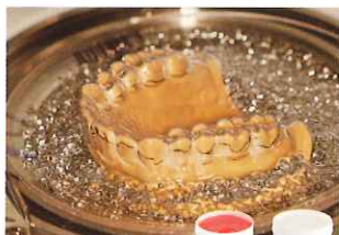
シルキッドでブロックアウト後上下顎装置の作成