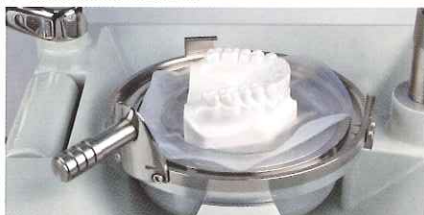
模型の前準備と設置

オススメのプレート デュランプラス、ニューインプレロンS PD、ニューデュラソフトPD