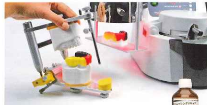
研磨後、フィニッシングキッドで表面のつや出し