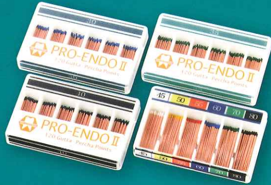
■形態表 メインポイント(国際規格カラーコード)