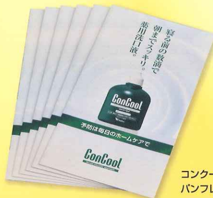
コンクールF パンフレット 6部