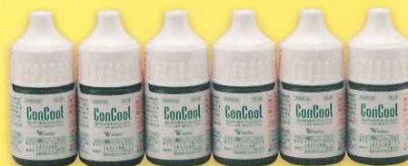
コンクールF トライアル ミニサンプル 6個