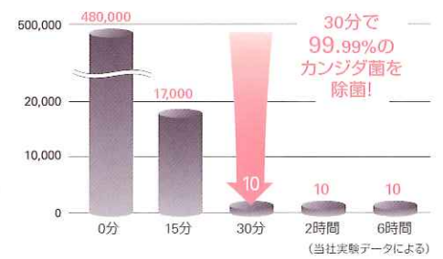
カンジダ菌除菌 生菌数 (mL)

⚠ 金属を使用した入れ歯は30分で取り出してください。(銀合金、銀ロウ材、チタンはご使用いただけません)