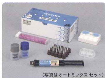
(写真はオートミックス セット)

ボンドマー ライトレスをお持ちでない先生は、 「エステセムⅡ」セットをご購入ください。