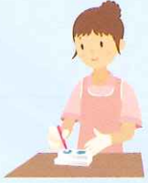
A液とB液を 出して混ぜる