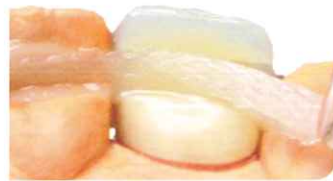
間接法による前歯 テンポラリーブリッジ (直説法でも可能)