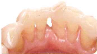
舌側固定法（直接法）