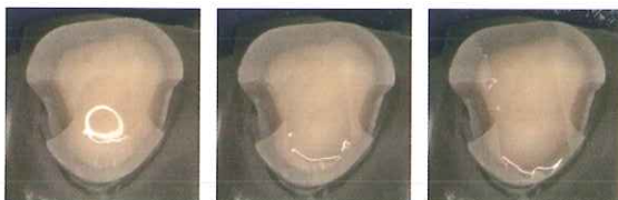
塗布直後 1秒後 3秒後 ボンディング材を塗布後、数秒で薄く自然に広がる様子

ボンディング材を塗布すると同時にアクティブに窩洞に自然に広がってゆき、薄く均一な皮膜を形成します。塗りムラによるドライスポットの発生やギャップの形成がなく、術後痛のリスクも軽減します。