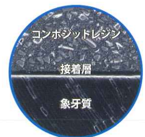
5~10μm以下の薄い皮膜を形成