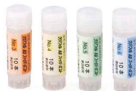
クリアフィル AD ファイバークラスト