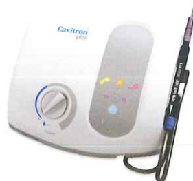
Cavitron® Plus MP Tap-On™