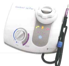
Cavitron® JET Plus Tap-On™