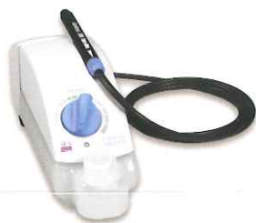
Cavitron® Select™ SPS™