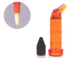
C-Rシリンジ専用ノズル アクュドースHV ノズルの口径をアクュドースLVより大きく設計。 高粘度レジンにも対応できます。

■標準価格 6,700円 新206230012 IB623012 (100個入、67円/個)