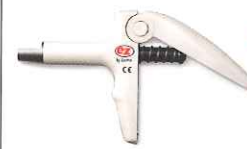
C-Rシリンジ マークIII E-2 「この原理」を応用し、力の加減と操作性を アップさせたガンタイプ。高粘度のレジンも 充填がスムーズです。

■標準価格 11,100円 新206230082 IB623082 (100個入、111円/個)