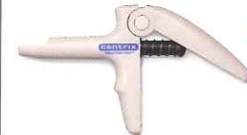
C-Rシリンジ マークIII スナップフィットレギュラー 軽くて壊れにくい強化プラスチック製。 先端のノズルをしっかりと固定。