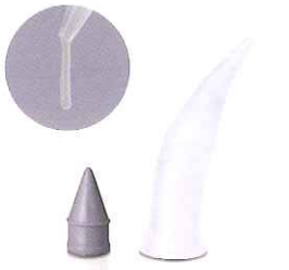
C-Rシリンジ専用ノズル レギュラータイプ おなじみのスタンダードタイプ

■標準価格 5,900円 新206230010 IB623010 (100個入、59円/個) 26,000円 新206230011 IB623011 (500個入、52円/個)