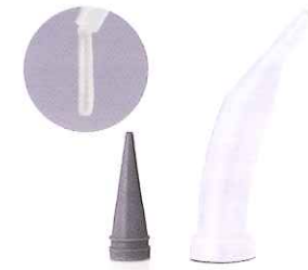
C-Rシリンジ専用ノズル ラージタイプ 容量はレギュラータイプの1.6倍! ノズルの口径をレギュラータイプより大きく設計。 臼歯部などの充填に適しています。

■標準価格 5,900円 新206230010 IB623010 (100個入、59円/個) 26,000円 新206230011 IB623011 (500個入、52円/個)