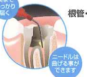
C-Rシリンジ専用ノズル アクュドース ニードルチューブ

根管・ポスト充填用 自在に曲がる先端部が根底部まで届くので、 根管への緊密な充填ができます。