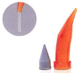
C-Rシリンジ専用ノズル アクュドースLV 半透明の素材が硬化光を遮断するので、 ゆとりを持って充填作業が行えます。

■標準価格 6,700円 新206230012 IB623012 (100個入、67円/個)