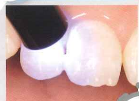
唇側面と口蓋側面から照射