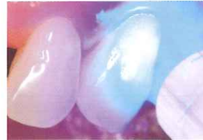
ボンドフィルSB プラスを充填、光照射