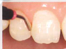
被着面にペースト(クリア)を塗布