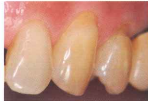
③④ にくさび状欠損を認める

咬合側方圧が加わる歯頸部の充填には、適度な柔軟性を有したボンドフィルSB プラスを使用することで、充填物の脱落や破折を防ぎます。