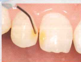
被着面にエッチャントゲルを塗布→30秒後、水洗・乾燥