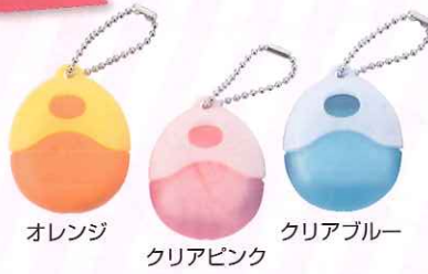
オレンジ クリアピンク クリアブルー 人工呼吸用携帯マスク(3色各1個)