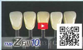
▶ カメラオン効果とは?