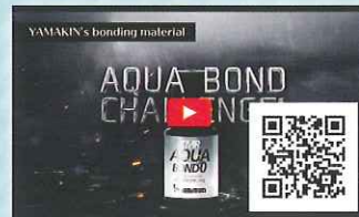
▶ アクアボンドチャレンジ