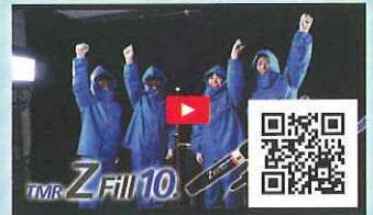
▶ ゼットタワーチャレンジ

TMR-ゼットフィル10. 管理医療機器 歯科充填用コンポジットレジン 認証番号: 230AABZX00066000 TMR-アクアボンド0 管理医療機器 歯科用象牙質接着材(歯科セラミックス用接着材料)(歯科金属用接着材料) 認証番号: 230AABZX00076000