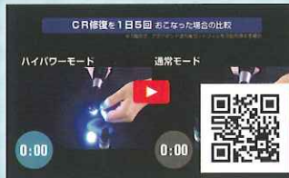
▶ ペンギンアルファで時間短縮