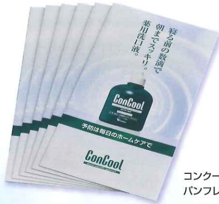
コンクールF パンフレット 6部