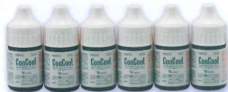
コンクールF トライアル ミニサンプル 6個