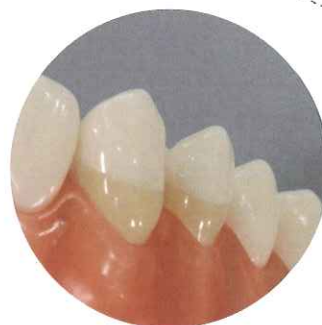
ナノフィラーにより 簡単な研磨で艶がでます