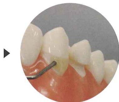
程良い粘稠度で 豊隆部デザインが整いやすい