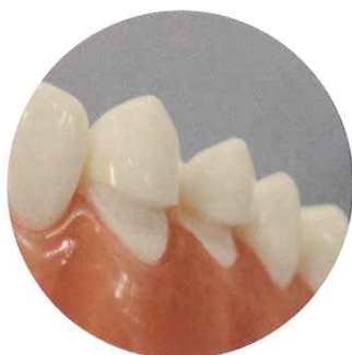
くさび状欠損 充填前