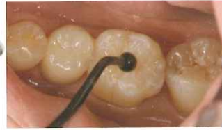
充填器による形態付与後、光照射※2