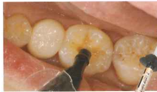
「クリアフィル®マジェスティ®IC」 (A2とA2Eを積層)を充填※1