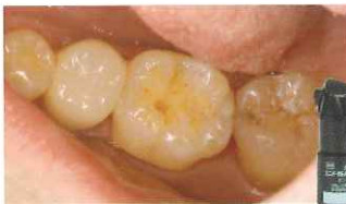
防湿・う蝕の除去・窩洞形成及び歯髄保護 「クリアフィル®ユニバーサルボンド Quick ER」による接着処理