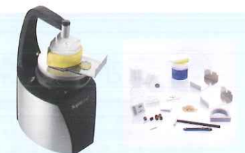
ジロフォーム ピンドリル

石膏の膨張を補正し、 超精密 な可撤式作業用模型の製作を 可能にしたシステム インプラント模型製作に最適