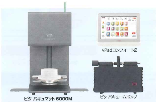
ビタ バキュマット 6000M