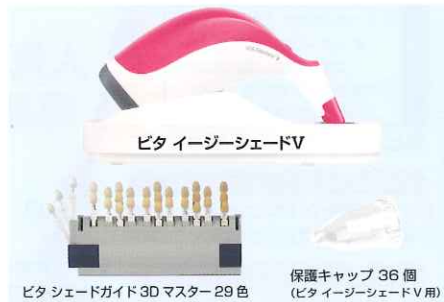
ビタ イージーシェードV