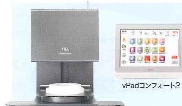
ビタ ジルコマット 6000MS