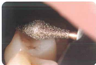
資料ご提供：遠山 敏成 先生 (東京都練馬区 マイスター春日歯科クリニック)