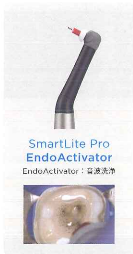
SmartLite Pro EndoActivator EndoActivator：音波洗浄