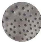
Treated with SmartLite Pro EndoActivator

柔軟性の高いノンカッティング 樹脂素材を採用し、レジンや トランスポーテーション、 根管壁を傷つけることはありません。