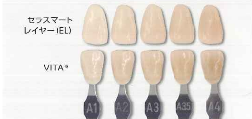
※VITAはVita Zahnfabrik H.Rauter GmbH & Co.KGの商標です。