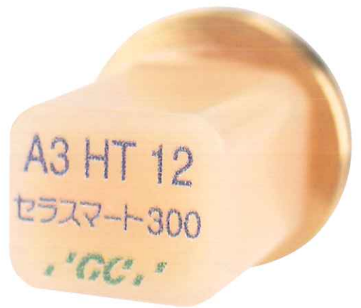
歯科切削加工用レジン材料 セラスマート レイヤー 管理医療機器 231AKBZX00004000