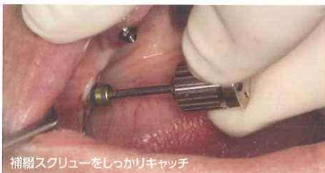
補綴スクリューをしっかりとキャッチ

インプラント補綴のメンテナンスに最適！新規患者さまにも対応できるレスキュードライバ For Doctor & Dental Technician