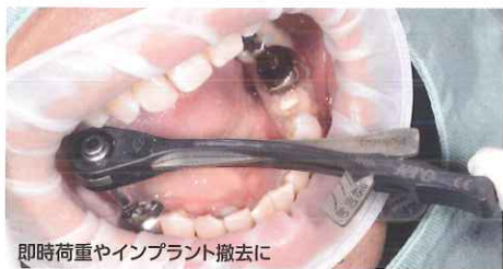
即時荷重やインプラント撤去に

互換性に優れ、80N・cmまでカバー！ Straumann、Zimmerユーザー様マストアイテム For Doctor