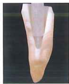
テーバーが大きく太い根管 【ファイバーポスト】 【スリーブ】