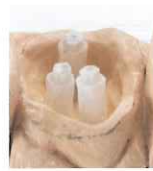
下顎大臼歯の太い根管 【ファイバーポスト】 【スリーブ】