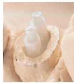
上顎小臼歯の太い扁平根管 【ファイバーポスト】 【スリーブ】