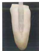
テーバーが小さい根管 【ファイバーポスト】

ファイバーポスト(光ファイバーポスト®, ポスト(ワイヤー入り))にスリーブ、アクセサリファイバーを組み合わせて使用することで、様々な形態の根管に対し適切なファイバーアレンジメントが可能です。