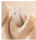
下顎前歯の細い扁平根管 【ファイバーポスト】 【アクセサリファイバー】