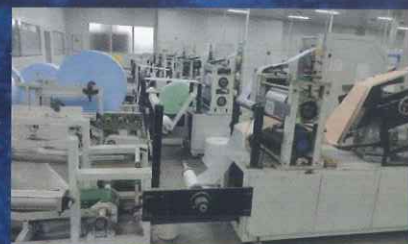
BSA向けに月間3万箱のエプロンの製造を行っています。