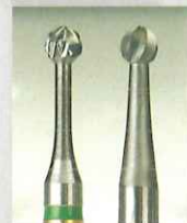
H1SEMと通常のスチールバー