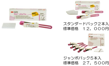
スタンダードパック2本入 標準価格 12,000円