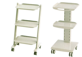
アシスタントカート マルチカート