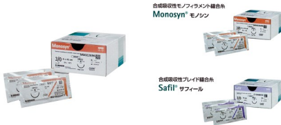
合成吸収性モノフィラメント縫合糸 Monosyn ® モノシン