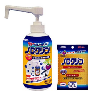
ボンプタイプ500mL 2,480円 シートタイプ20枚入 498円