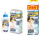
1L 1,680円 500mL 980円