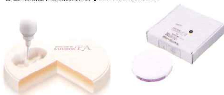
CAD/CAM用高透光性セミシンタージルコニアディスク 松風ディスク ZR-SS ルーセント FA