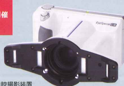
デジタル口腔撮影装置 アイスペシャル C-III