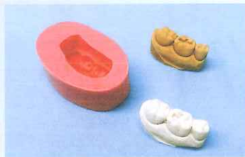
ポーセレンインレー耐火模型