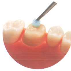
シーリング・コーティング

シーリング・コーティング以外にも知覚過敏抑制材、ボンディング材としてもご使用いただける、マルチユース材料です。