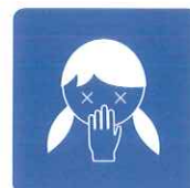
吐瀉物処理時の除菌に