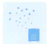
次亜塩素酸水対応 噴霧器で室内の除菌に