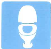
トイレの除菌・消臭に