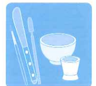
スパチュラや ツール類の除菌に