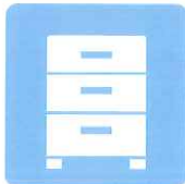
キャビネットの除菌に