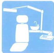
ユニットまわりの除菌に