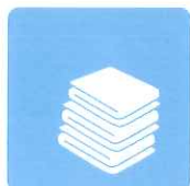
タオルや布類の 除菌・消臭に