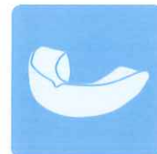
マウスガードや ホワイトニングトレイの除菌に