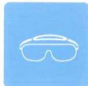
保護メガネの除菌に