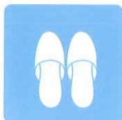
スリッパの除菌・消臭に