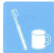
歯ブラシやTBI時の ツールの除菌に