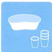
往診時の ツール類の除菌に