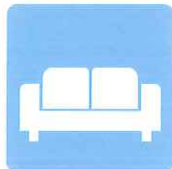
待合室のソファや テーブルの除菌に